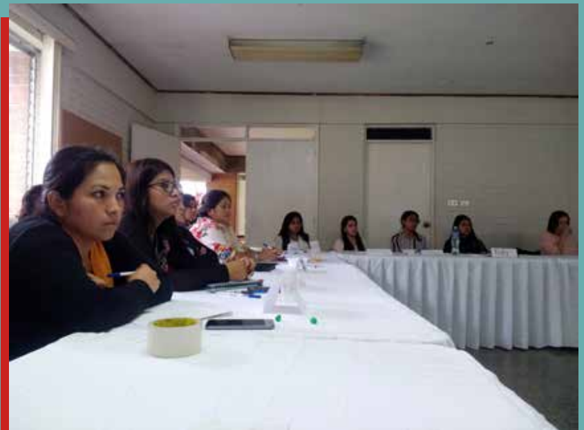
Las secretarías y asistentes adquirieron nuevos conocimientos para desempeñar de mejor manera tan importante labor.