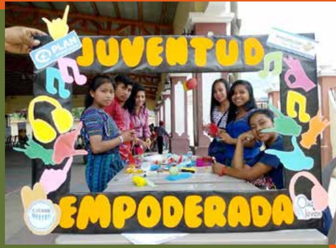
Los jóvenes promueven su liderazgo a través de proponer proyectos para su comunidad