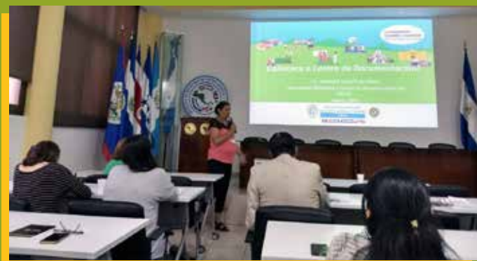
Presentación del Centro de Documentación virtual de Plantas Nativas, marzo 2018.