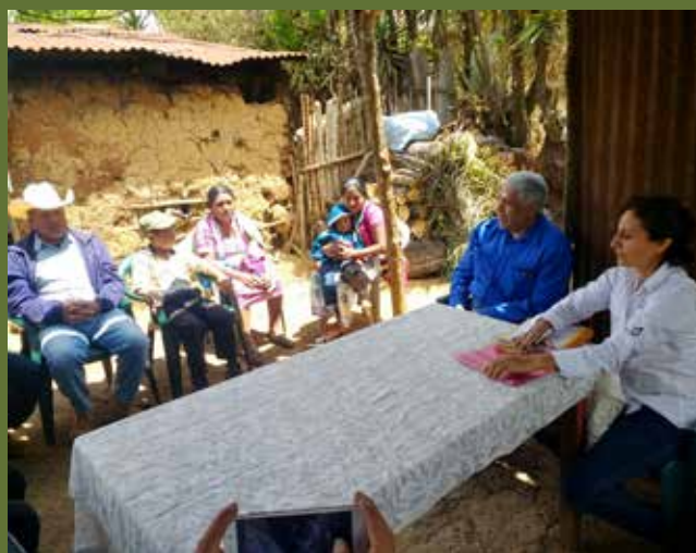
En las visitas se pudo compartir con comunidades atendidas por ASEDECHI en Chiquimula