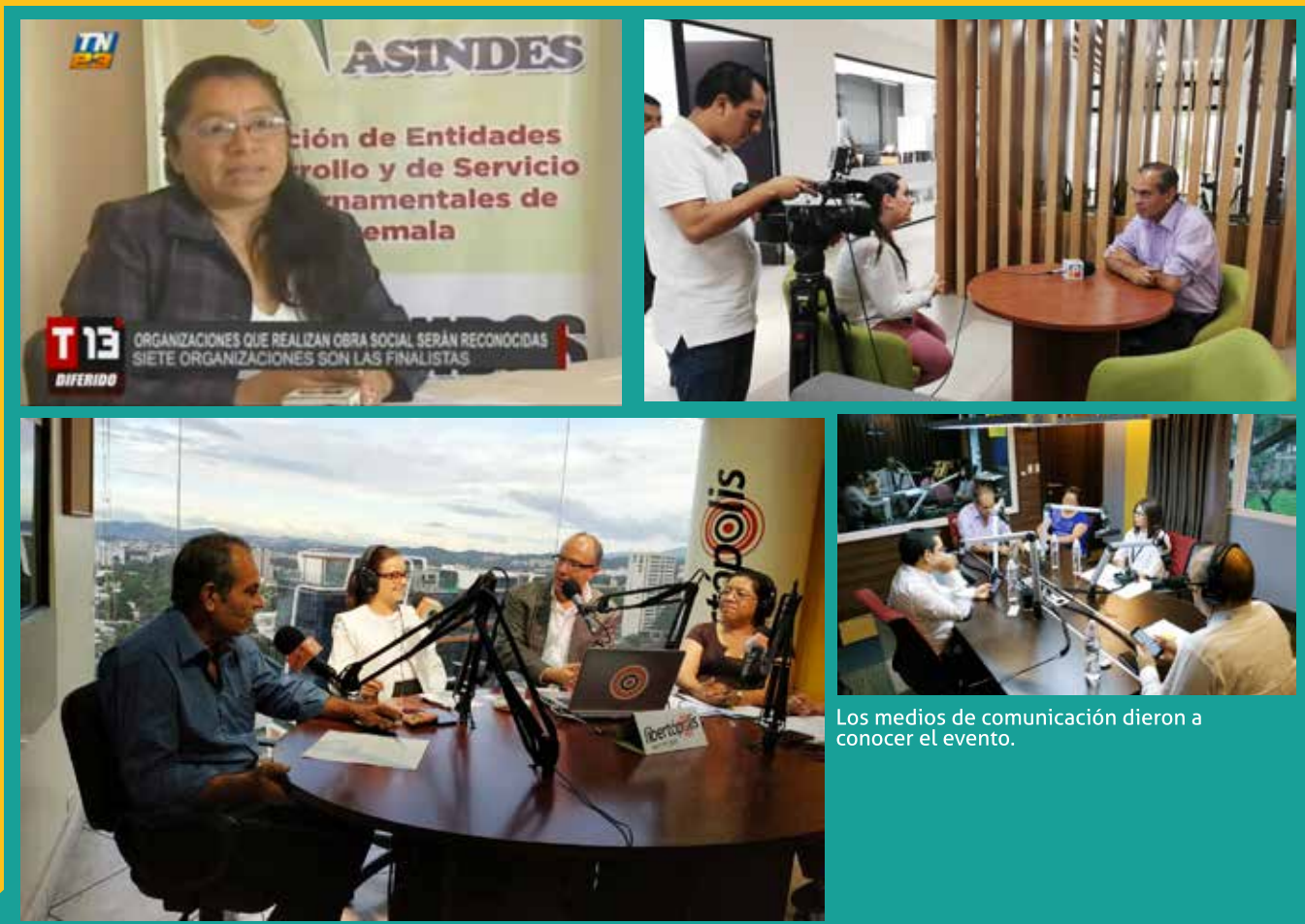
Los medios de comunicación dieron a conocer el evento.

Programa Inversión y Desarrollo: posterior al evento.