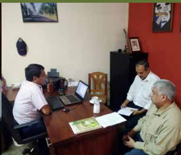
Visita a ASDESARROLLO en febrero 2018