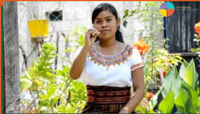
Las personas beneficiarias del proyecto cuentan con orientación vocacional y formación profesional que les ha facilitado su inclusión laboral.