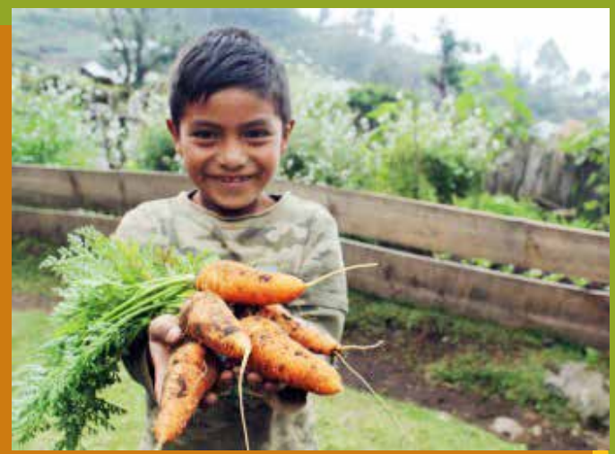
El acceso y consumo de alimentos nutritivos ayudarán a la reducción de la desnutrición en la comunidad.

2. Reducción de la Desnutrición y Aumento de la Economía Local: La capacitación fue primordial en esta fase, pues contribuyó a que las personas pudieran tomar decisiones importantes para el consumo de alimentos nutritivos que permitan reducir la desnutrición en la comunidad. Para esto, se implementaron Huertos familiares y comunitarios para la producción de alimentos de auto consumo. Estos huertos permitieron que las familias contaran con vegetales y frutas disponibles para su nutrición e incluso se tuviera la posibilidad de excedentes para la venta, con lo cual se ayudó a la economía familiar.