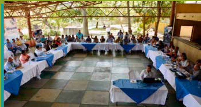
Reunión celebrada abril 2018