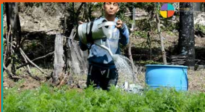
Los participantes del proyecto, ahora se sienten parte de la comunidad

El trabajo del personal de Asociación Centro Maya ha permitido que a mediano plazo las personas beneficiarias del proyecto cuenten con orientación vocacional y formación profesional que les ha facilitado su inclusión laboral.