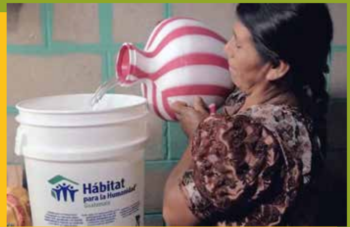
La fase 1 del proyecto incluyó la dotación de filtros purificadores de agua.

1. Servicios Básicos: esta fase incluyó la construcción, por parte de los beneficiarios, de una estufa ahorradora de leña y una letrina de pozo ciego ventilado. Además, se dotó a las familias de un filtro purificador de agua.