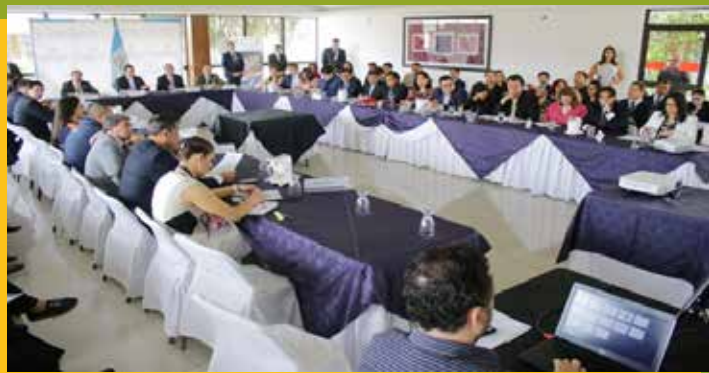
Sesión de CONASAN, septiembre 2018

En cumplimiento de los Objetivos Institucionales, ASINDES, se ha empeñado en participar en Instancias Multisectoriales que contribuyen a la integración del Sector ONG y la generación de alianzas, a través de coordinaciones interinstitucionales. Como Coordinadora, ASINDES, tiene representación en las instancias siguientes: