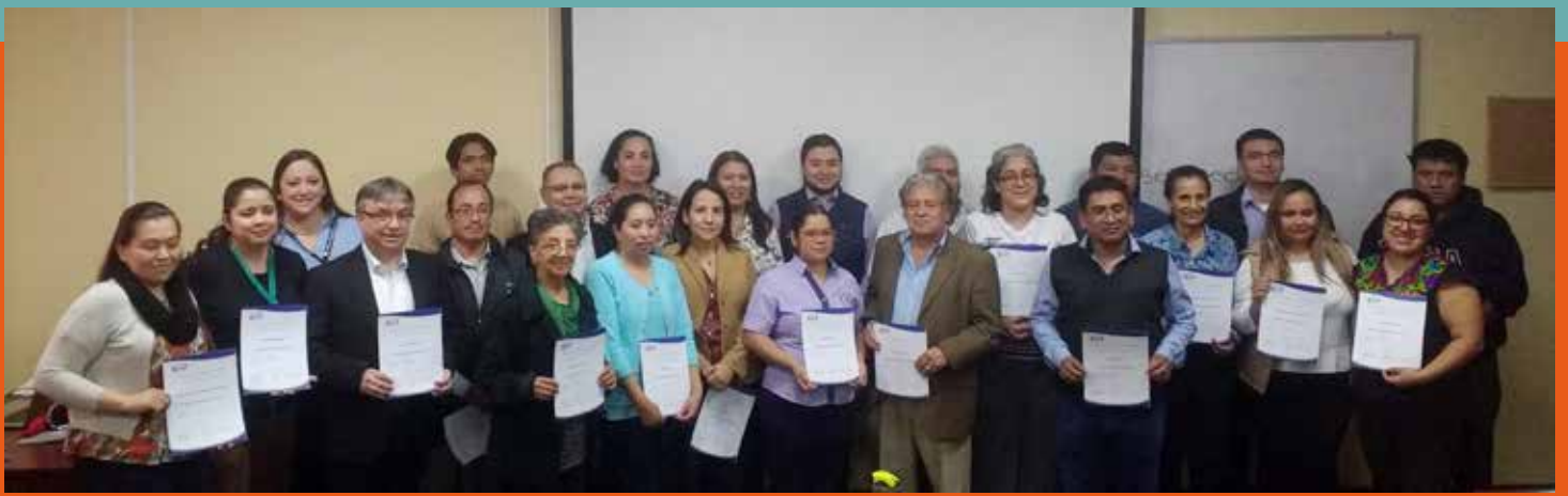
Participantes de 14 organizaciones, estuvieron presentes en el Taller Elaboración de Diagnóstico de Necesidades de Capacitación (DNC)