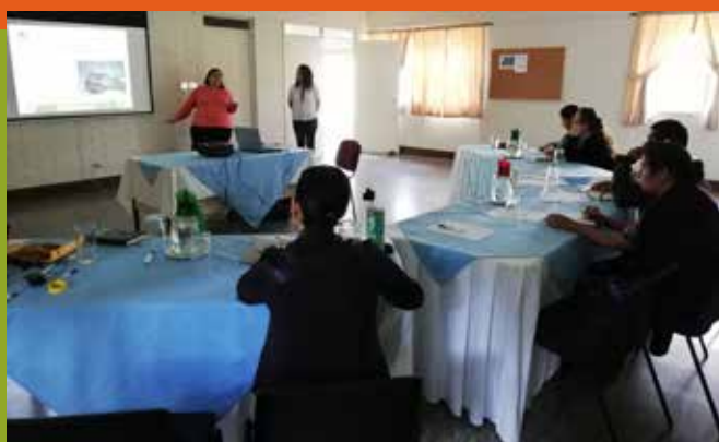
Mesa Sectorial de Desarrollo Económico, agosto 2018