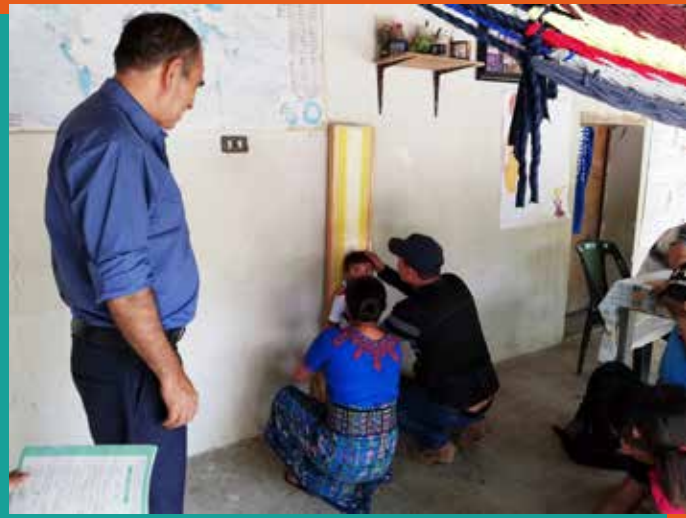
Otras Organizaciones No Gubernamentales del municipio otorgan pasantías e incluso oportunidades de empleo a los jóvenes egresados del proyecto.

Continuar estudiando el nivel diversificado y universitario, así como conseguir un primer empleo donde poner en práctica los conocimientos adquiridos, son los principales desafíos que deben de enfrentar los jóvenes que viven en el municipio de Rabinal, Baja Verapaz.