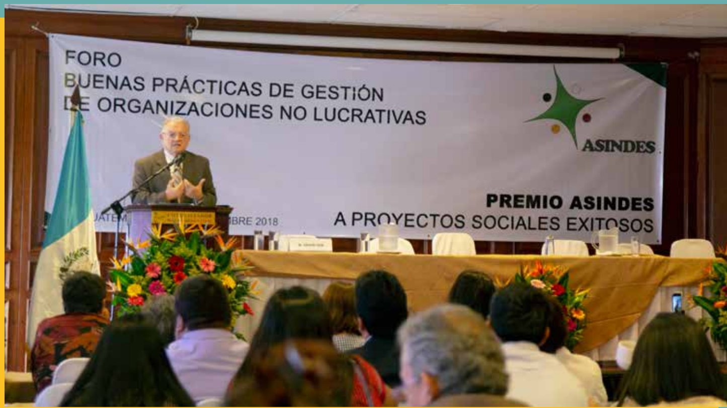
Dr. Eduardo Stein, exvicepresidente de la República de Guatemala, fue parte de los conferencistas del Foro Buenas Prácticas de Gestión de Organizaciones No Lucrativas.

ASINDES como Coordinadora de 24 organizaciones y representante del Sector ONG en espacios intersectoriales, asumió en el año 2018 el reto de organizar el Foro BUENAS PRÁCTICAS DE GESTIÓN DE ORGANIZACIONES NO LUCRATIVAS, con el propósito de convocar y reunir a organizaciones de Desarrollo de todas las regiones de Guatemala, para reflexionar sobre algunos temas de interés y relevancia común.