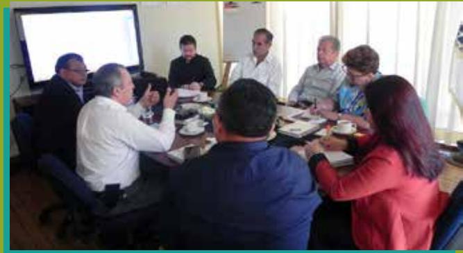
Representantes de CODINO, RED FASCO, REDIMIF y ASINDES en reunión de Análisis Actualización al Reglamento del Fideicomiso para la Promoción de las MIPYMES

Entre los aportes de ASINDES al CONAMIF se encuentran: el análisis de la Iniciativa de Ley 5257, así como los procesos legales que aplicarían en caso fuera aprobada por el Congreso de la República. También participó del análisis de la Actualización al Reglamento del Fideicomiso para la Promoción de las MIPYMES, administrado por el Ministerio de Economía.